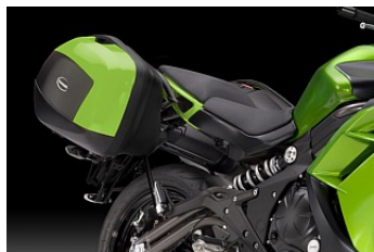
PACKVÄSKOR 3 811,00 kr