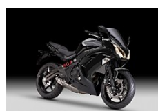
Metallic Spark Black