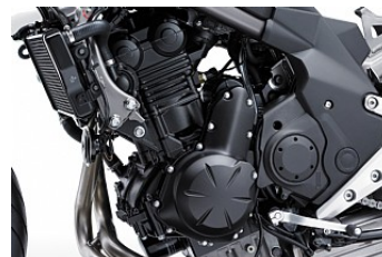
KOMPAKT, VARVILLIG MOTOR MED BÄTTRE RESPONS I LÅG- OCH MELLANREGISTRET