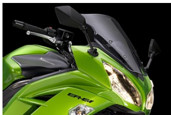
VINDRUTA - RÖKFÄRGAD 1 059,00 kr