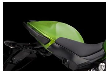
MJUK SADELKUTS 2 124,00 kr