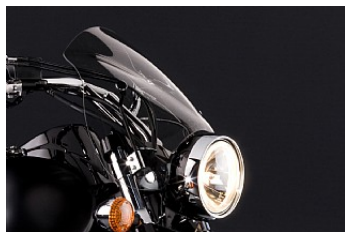
VINDRUTA CAFÉ 1 818,00 kr