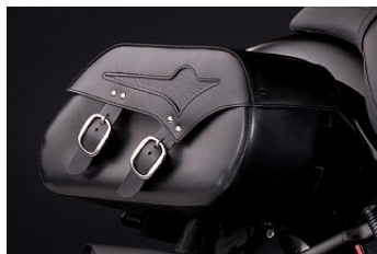
SADELVÄSKOR Cirkapris 4 978,00 kr