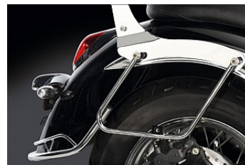
SADELVÄSKOR, FÄSTE 736,00 kr