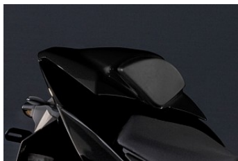
SADELKUTS 1 315,00 kr