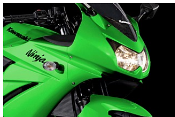
Supersport-design i toppklass