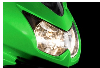
Aggressiva dubbla strålkastare