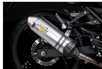
LEOVINCE EVO2 AVGASSYSTEM* 4 794,00 kr