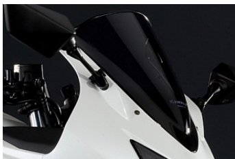
BUBBELRUTA 847,00 kr